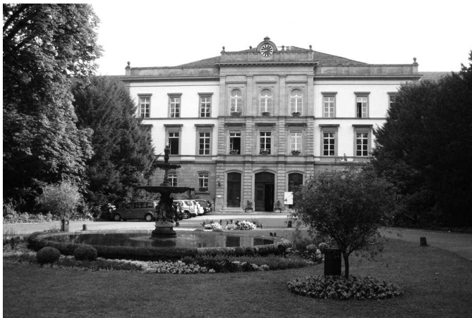
La clinique de Königsfelden.