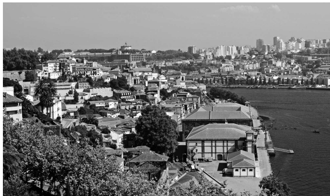
Porto, le Duro et, au premier plan, le palais des congrès où le colloque a eu lieu.